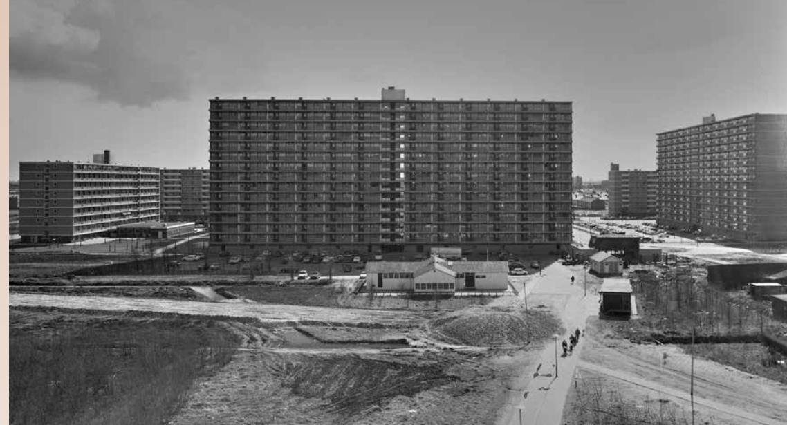
Foto- Postkantoren nabij de Stresemann- en Kelloggflat

Ook een meevaller was dat de RET pal voor deze winkel een bushalte aanlegde van lijn 46. Althans per 2 mei. Aan de Molenlaan kon men overstappen op tramlijn 4 om in het centrum komen.